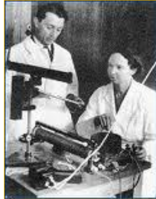
Manželé Curieovi Jáchymov – první vzorky prvku rádium