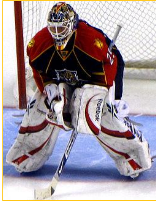
Tomáš Vokoun hokejový brankář